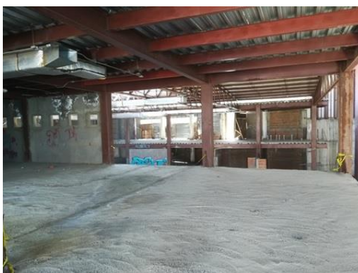
Vista al interior de la