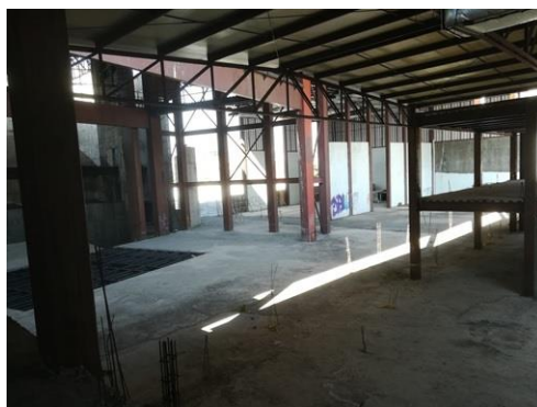
Vista al interior de la Plaza Bicentenario