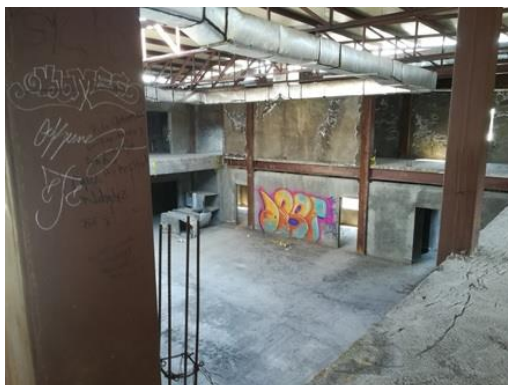
Vista al interior de la Plaza Bicentenario