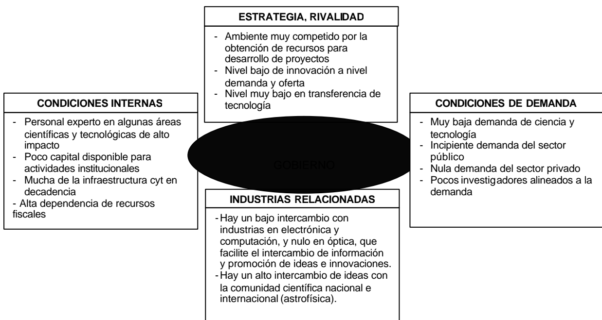
Ilustración 2. Diamante de Porter (Elaboración propia)

Pese a que Porter, con base en la descripción anterior, ubica al gobierno afuera de las cuatro fuerzas del diamante, en México prevalece la postura dominante del mismo en la vida de las instituciones públicas y privadas, predominando un ambiente altamente politizado y monopolizado en muchos sectores estratégicos para el país. Por lo tanto, en la ilustración 2, se muestra al gobierno como pieza fundamental para el análisis estratégico de un centro de investigación como el INAOE.